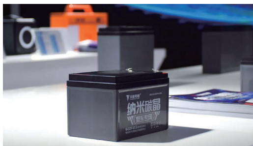
天能推出首個運用「納米碳金」與「鏽晶合金」新型材料的高端環保電池

天能高度重視技術研發工作，現已形成「總部國際研究院+事業部技術中心+生產基地技術部」三級研發架構。本集團植根鉛蓄電池業務，加速發展鋰電池業務，穩步推進燃料電池產業化，持續探索鈉離子電池、固態電池等新型電池技術；致力於新技術、新工藝、新材料的研發和使用，滿足多元市場和客戶的需求，打造公司高質量發展的核心競爭力。報告期內，天能推出首個運用「納米碳金」與「鏽晶合金」新型材料的高端環保電池、「衡科技」系列超能錳鐵鋰電池、鋰離子移動儲能電源產品及五大全新系列汽車起動啟停電池。同時，公司與雅迪集團（證券代碼 1585.HK）聯合發佈了氫能源電動自行車，裝載著天能 T60-C 氫燃料電池系統的南京金龍城市客車也登上了中華人民共和國工業和信息化部（「工信部」）第 345 批《道路機動車輛生產企業及產品》名單。