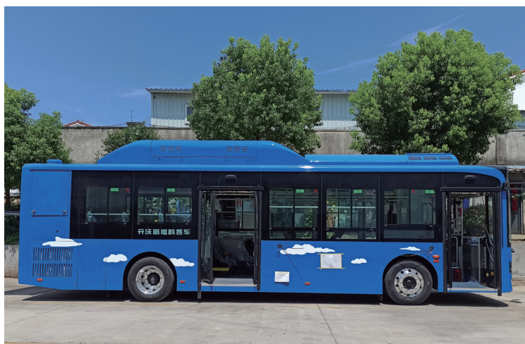
裝載天能氫燃料電池系統城市客車

今年來，公司燃料電池市場化應用進程加快。在今年三月舉辦的北方國際自行車電動車展覽會期間，天能與雅迪集團圍繞氫能電車達成戰略合作協議，雙方將攜手推進氫能電池研究，正式發佈氫能源電動自行車，共同推進氫能源電動自行車商業化進程。於二零二一年四月，由天能自主研發的高性能TNFC-LP2020型號水冷電堆產品，正式匹配德燃動力的FCV6座版觀光車，並在中國燃料電池汽車示範應用城市群的牽頭城市——嘉興進行示範運營。二零二一年六月，工信部公佈了第345批《道路機動車輛生產企業及產品》名單，裝載著天能T60-C氫燃料電池系統的南京金龍NJL6106產品型號的燃料電池城市客車上榜。這標誌著天能氫燃料電池系統成功進入了燃料電池汽車應用領域。公司也正積極接洽其他領域如特種動力、乘用車等廠商，謀劃深度合作。