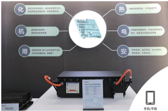
新能源汽車鋰離子動力電池

天能多方位佈局新能源產品。公司鋰離子電池產品適用於純電動汽車和混合動力汽車。集團現已與海全、鴻日、麗馳等新能源汽車廠商達成戰略合作關係，為其供應鋰離子動力電池產品。在智慧能源方面，集團鋰離子儲能電池目前主要應用於通信基站、用戶側削峰填谷、離網電站、微電網、UPS等領域，並獨立研發儲能機櫃系統。天能還推出多款面對個人用戶的移動儲能電源產品，適配戶外用電、各類急需用電的生活與生產場景。在消費鋰電池方面，天能產品以其優越性能和高品質，在兒童車、玩具、電動工具、電子影音等領域應用廣泛。