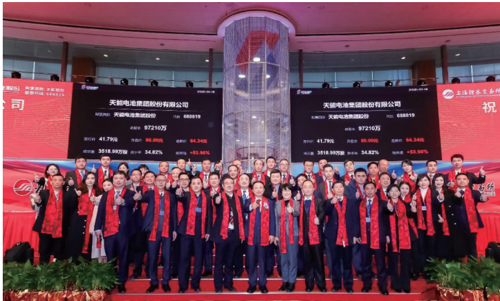
本公司之控股子公司天能電池集團股份有限公司(證券代碼688819.SH)在上海證券交易所科創板掛牌上市。

依托近年來穩健增長的業績表現及市場發展潛力，天能獲得資本市場進一步認可。報告期內，本公司被納入恒生滬深港智能及電動車指數，成為唯一一家入選該指數的港股電池行業上市公司。二零二一年一月，本公司之控股子公司天能電池集團股份有限公司(證券代碼688819.SH,「天能股份」)在上海證券交易所科創板掛牌上市。天能股份於二零二一年六月被納入全球第二大指數編制公司富時編制的中國A400指數，並於同月成為首批中證指數有限公司編制的科創創業50指數(「雙創50」)成分股之一。