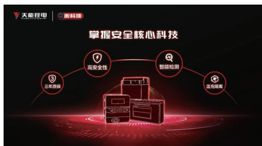
「衡科技」系列超能錳鐵鋰電池