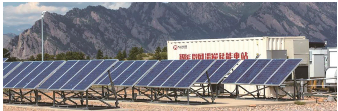
高性能鉛炭電池儲能項目