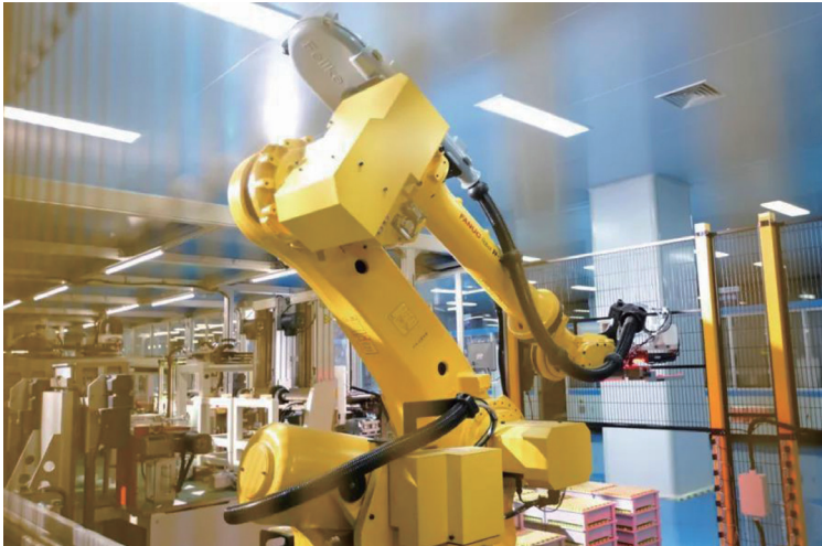
天能綠色智能制造工廠

近年來，天能以綠色智能製造為主攻方向，以抓數字經濟為契機，重點搭建用戶生態圈運營平台及工業互聯網平台，建成「雲上天能」。本集團先後建設了新能源汽車動力電池智能工廠、天暢智庫產業園、天能綠色制造產業園等多個數字化項目。報告期內，本集團成功入選浙江省經濟和信息化廳公佈二零二一年浙江省「未來工廠」試點企業名單，及二零二一年度省級重點工業互聯網平台項目。