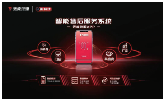
天能自主開發電池智能檢測軟件——「天能帥服」