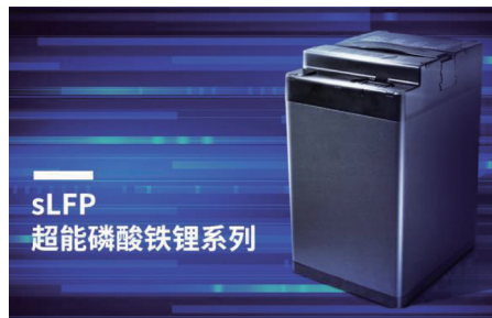
天能自主研發的超能錳鐵鋰 (LMFP) 電池及超能磷酸鐵鋰 (sLFP) 電池