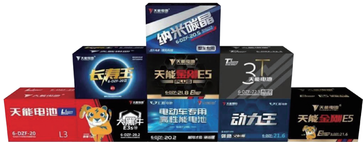
天能針對不同細分領域需求推出各類二輪及三輪電池產品

在行業健康發展的背景下，公司在研發投入和產品質量上持續精進，推出新產品。報告期內，公司推出了行業內首個運用「 納米碳晶 」與「 鏽晶合金 」新型材料和720°立體混膏前沿工藝的納米碳晶整車專用電池，解決了鉛蓄電池正、負極添加劑方面的問題，滿足消費者對「耐用耐跑，質優價美」的需求。截止目前，公司已建立「 納米碳晶 」、「 金剛 」、「 真黑金 」、「 長壽王 」、「 長跑王 」、「 大黑牛 」等全系列產品，符合不同細分領域的需求。報告期內，電動二輪及三輪車電池銷量約為36 GWh，較上年同期增加約14.86%。