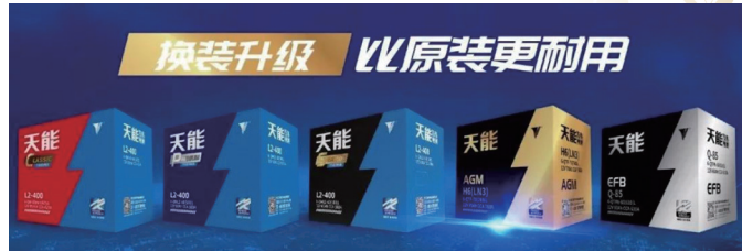
天能全新理念的汽車起動啟停電池電池產品

展望未來，天能汽車起動啟停電池，將依託本集團的品牌優勢及技術積累，不斷開拓市場潛力。